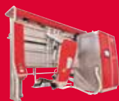
Lely Astronaut A5

Nos solutions en automatisation de l'élevage